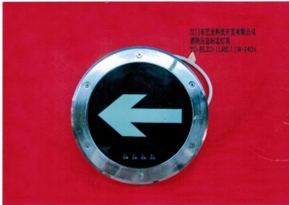
产品型号: YG-BLZD-1LRE I 1W-1404 (图 B. 5)