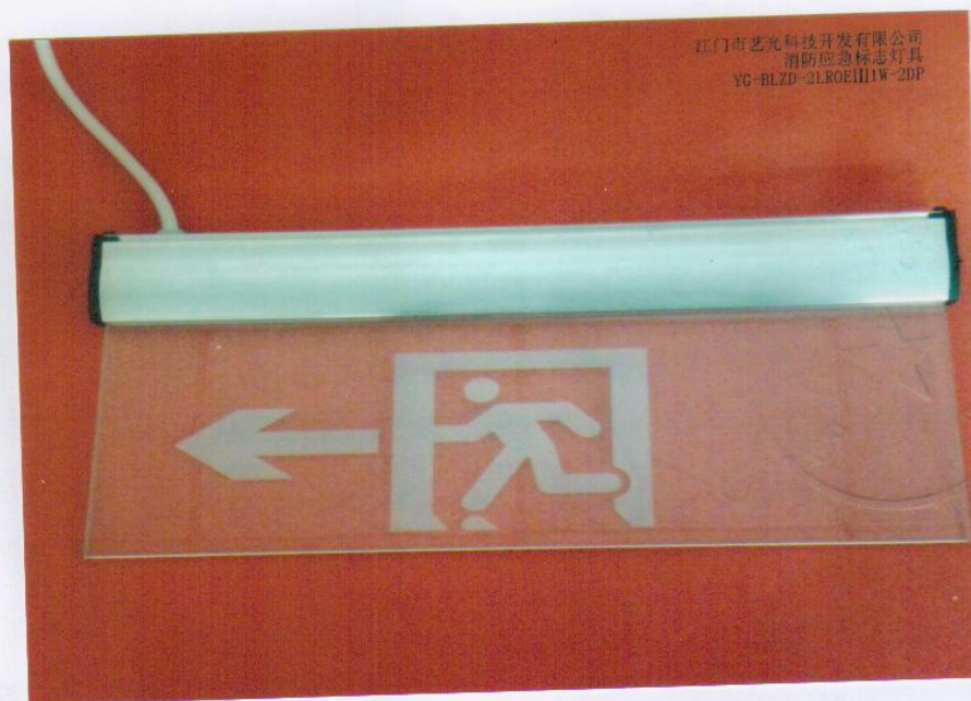
产品型号：YG-BLZD-2LR0EIII1W-2DP（图 B. 1+图 B. 5）