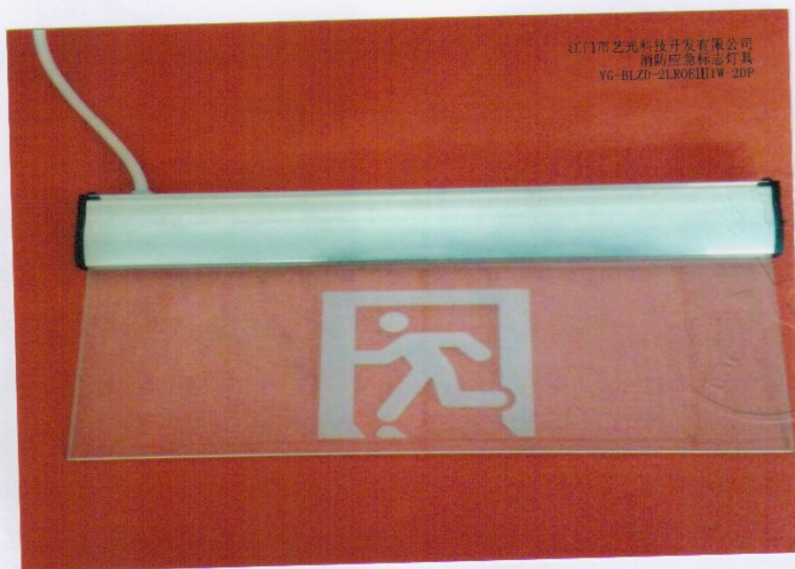
产品型号：YG-BLZD-2LR0EIII1W-2DP（图 B. 1）